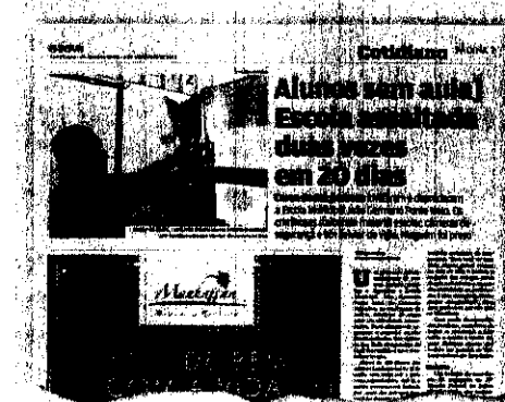
Escola do Conjunto Palmeiras foi invadida na semana passada

A insegurança e o medo, segundo a professora ouvida pela reportagem, se intensificaram nos últimos dois anos. "Nós sempre soubemos da existência dos conflitos. Eles existem e estão adentrando os muros da escola. Alguns