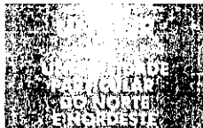
*Ranking Universitário Folha 2013