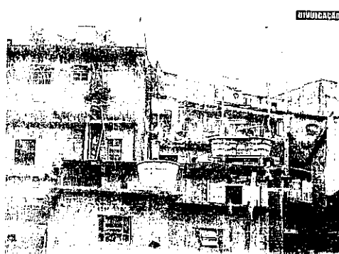
Segundo o IBGE, mais de 440 mil pessoas moram em favelas no Ceará. São mais de 120 mil casas irregulares

O abismo que separa as favelas do "asfalto" se replica