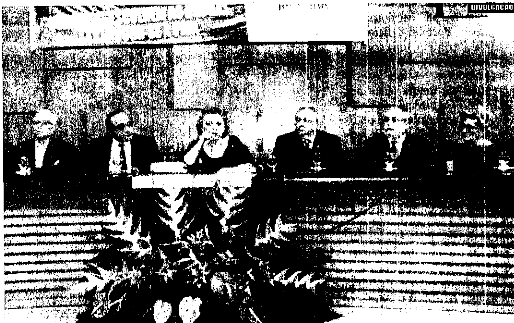
➔ MP discutirá a participação de gestores municipais, profissionais da saúde, educação e segurança pública formas de enfrentar a expansão das drogas em cidades do interior

O secretário executivo do Conselho Estadual de Po-