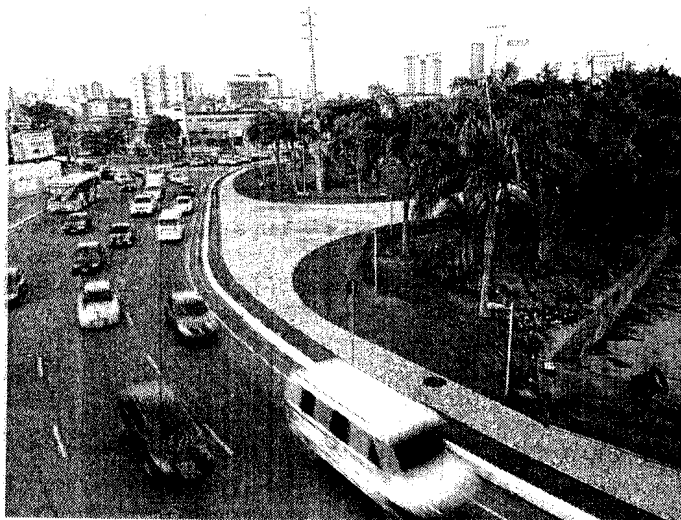
O novo viaduto está previsto para ser construído por cima da rotatória da avenida Aguanambi, no sentido Centro-Messejana