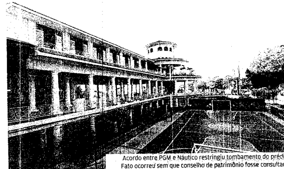
Acordo entre PGM e Náutico restringiu tombamento do prédio. Fato ocorreu sem que conselho de patrimônio fosse consultado