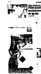
Reportagem do O POVO 3/8/2013 sobre a igreja

Na carta aberta , Compchic ainda aponta necessidade de condições mais adequadas para atuação da Coordenação de Patrimônio Histórico e Cultural (CPHC), da Secultfor, "especialmente no tocante ao preenchimento dos quadros técnicos relativos à pesquisa, análise de processos e fiscalização de bens tombados". A coordenação é responsável por abrir os processos tombamento.