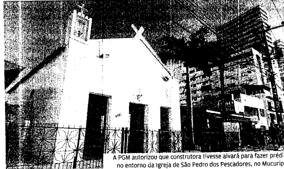
A PGM autorizou que construtora tivesse alvará para fazer prédio no entorno da Igreja de São Pedro dos Pescadores, no Mucuriçê

Leia a íntegra da carta aberta do Compchic no portal O POVO Online: http://is.ed/Lswv1