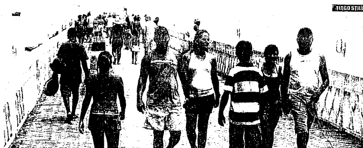
Seo Fortaleza uma das cidades-sede da Copa de 2014, haverá aumento significativo de turistas