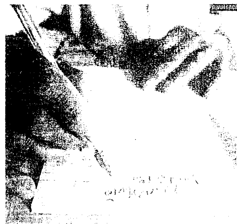
75% dos analfabetos cearenses residem no interior

Com relação à distribuição espacial, a região Nordeste detém 54% dos analfabetos do Brasil, o que equivale a um contingente de mais de sete milhões de pessoas. Embora os níveis atuais sejam ainda expressivos, na última década a taxa de analfabetismo no Brasil e, analogamente, na região Nordeste e no Ceará, seguiu uma trajetória de queda. O trabalho do Ipece analisa o perfil do analfabetismo com base nos dados da Pesquisa