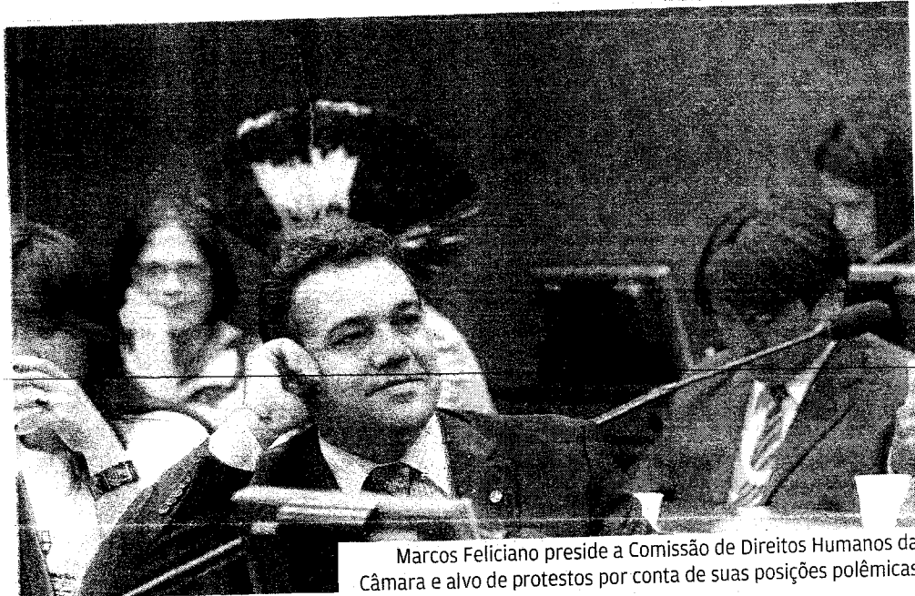
Marcos Feliciano preside a Comissão de Direitos Humanos da Câmara e alvo de protestos por conta de suas posições polêmicas