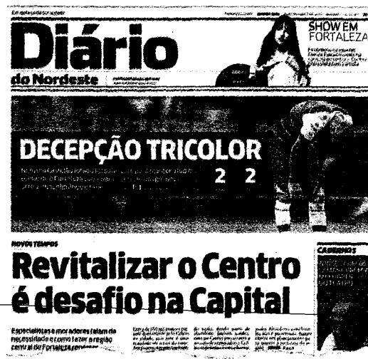
O Diário do Nordeste abordou, na edição desta segunda-feira, os problemas de conservação da memória do Centro e valorização do tradicional bairro

as duas ações visam mudar o perfil de ocupação do bairro. De um lado, a administração municipal almeja encorajar a instalação de residências no quadrilá-