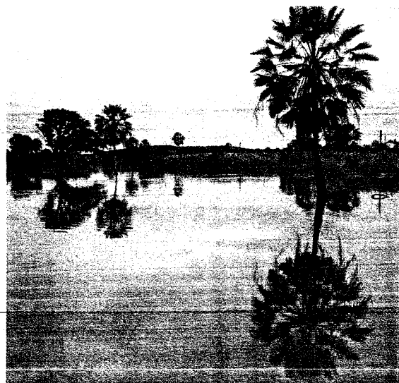
Legislação federal, como o novo Código Florestal, precisa de adequação para as especificidades do Ceará, como a Caatinga e suas peculiaridades.

Ao mesmo tempo, algumas leis não são regulamentadas. Portanto, o Ceará, por meio da Superintendência Estadual do Meio Ambiente (Semace), acaba seguindo leis federais. De