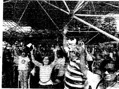
A decisão pela greve partiu de uma assembleia realizada na manhã de ontem na sede do órgão. Os 550 trabalhadores estatutários do Departamento, em todo o estado, reivindicam, principalmente, um plano específico de Cargos, Carreiras e Salários (PCCS). Sem fim determinado, a greve deve afetar a prestação de serviços relacionados ao registro de veículos, habilitação e fiscalização de ônibus e vans intermunicipais.

Servidores do Departamento Estadual de Trânsito (Detran/CE) entrarão em greve a partir da próxima quinta-feira, 17. A decisão partiu de uma assembleia realizada na manhã de ontem na sede do órgão. Os 550 trabalhadores estatutários do Departamento, em todo o estado, reivindicam, principalmente, um plano específico de Cargos, Carreiras e Salários (PCCS). Sem fim determinado, a greve deve afetar a prestação de serviços relacionados ao registro de veículos, habilitação e fiscalização de ônibus e vans intermunicipais.