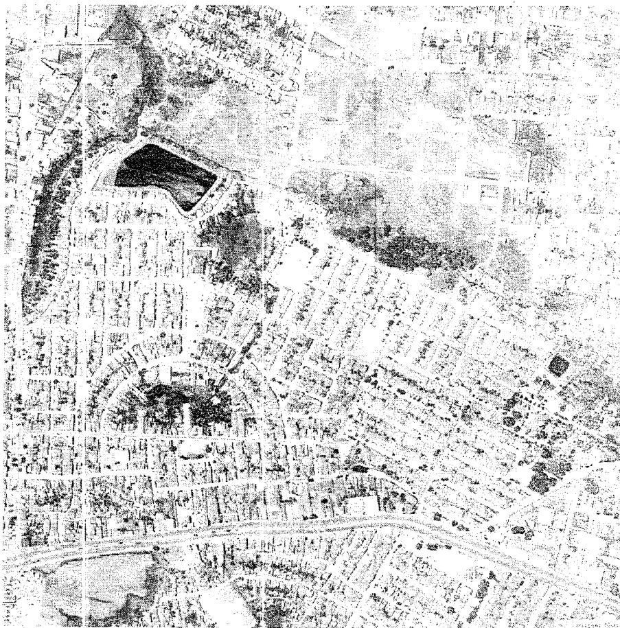
maior sistema hiibrico da cidade passa por 17 bairros -rr- seus 50 Km. de extens3o