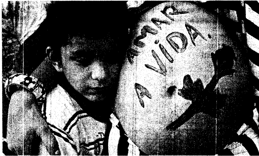
A Marcha Pela Vida Contra o Aborto contou com a participação de ativistas em defesa da conservação dos direitos humanos desde a concepção do nascituro. Entre a multidão, gestantes pintaram as barrigas com mensagens positivas.

A caminhada foi animada pela presença da cantora baiana