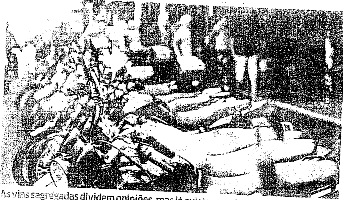
As vias segregadas dividem opiniões, mas já existem em locais como São Paulo, além de países asiáticos como Tailândia e Taiwan.

então, o presidente dos Psicólogos de Wagner Paiva, não é um problema Ceará. "É uma