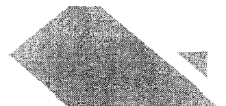
ROBERTO CLÁUDIO RODRIGUES BEZERRA PREFEITO MUNICIPAL DE FORTALEZA

Câmara Municipal, Fortaleza, 03 de junho de 2013.