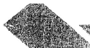
ROBERTO CLÁUDIO RODRIGUES BEZERRA Prefeito Municipal de Fortaleza

PAÇO MUNICIPAL, Fortaleza, 11 de abril de 2013.