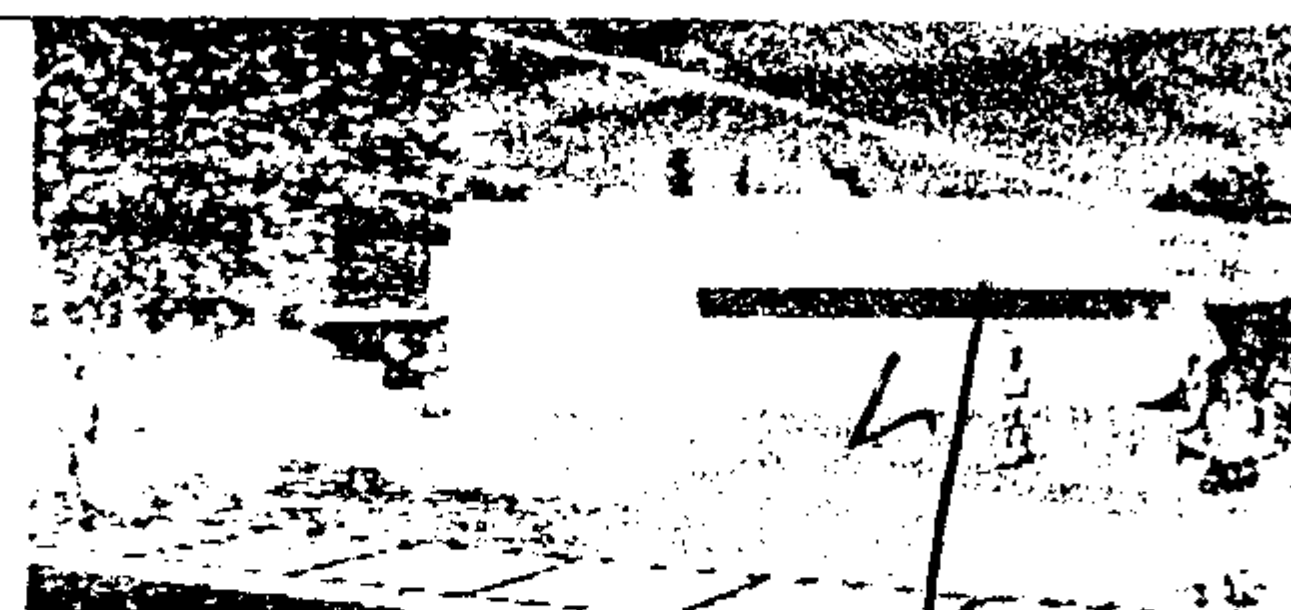
Câmara Municipal de Fortaleza